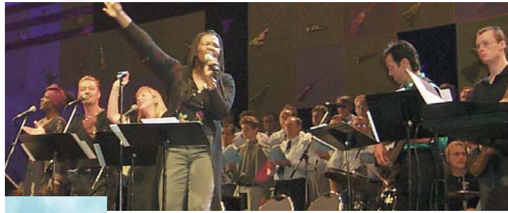
第18屆世界浸信聯會聚會中的敬拜隊